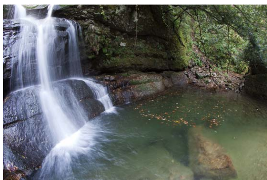
阿瀬溪谷の名瀑 月照滝