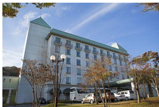
神鍋高原のリゾートホテル BLUE RIDGE HOTEL