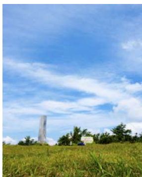
但馬の山々の展望台 蘇武岳