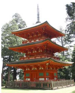
国指定の重要文化財 名草神社