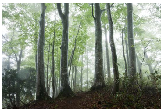
新緑のブナ林 ブナ林